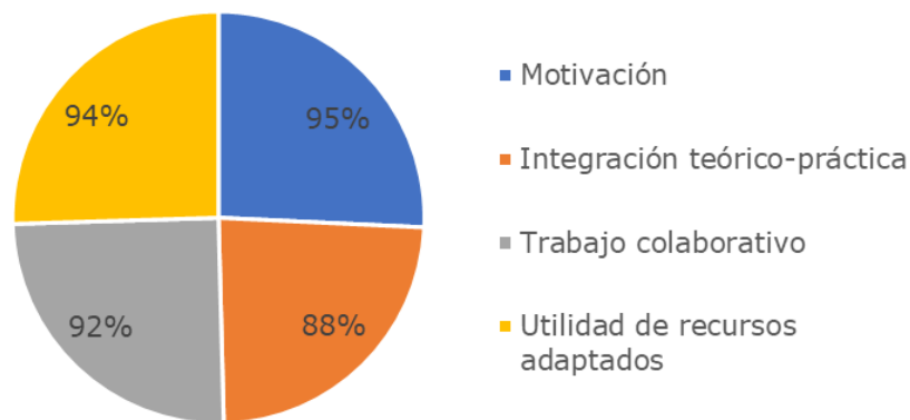
Figura 3. Percepción estudiantil sobre metodología ABP (elaboración propia)