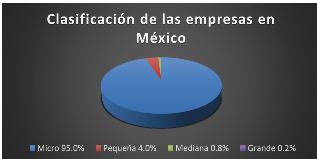
Figura 1 Clasificación de las empresas en México según su tamaño.

En este sentido, es necesario que las MiPymes desarrollen estrategias para su competitividad favoreciendo incrementar su productividad e impulsando un crecimiento sostenido (Solleiro & Castañón 2005). En un contexto regional, la realidad en el Estado de Durango, es la misma que a nivel nacional.