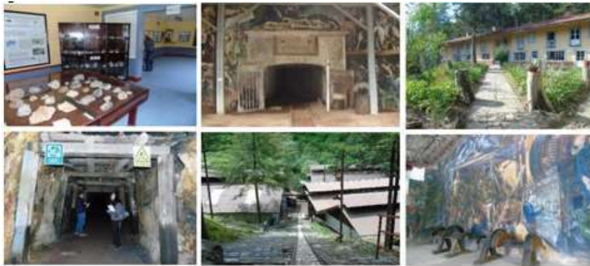
Figura 2. Conjunto de fotografías del Museo Tecnológico-Minero del Siglo XIX Mina Las Dos Estrellas.

vetillas de calcita. En el área, de un clima templado, existe un bosque de coníferas con pino, oyamel y junípero (Figura 2).