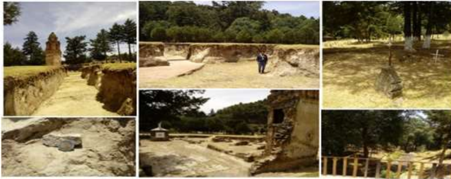
Figura 4. Conjunto de fotografías. Iglesia del Carmen.