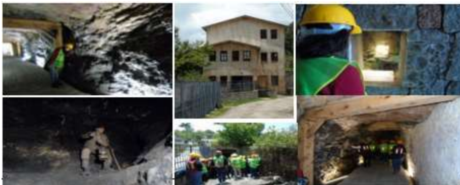
Figura 5. Diferentes vistas del Socavón San Juan.

Una de las vetas más importantes, es la San Rafael, de forma lenticular, con un rumbo variable entre 10^\circ y 40^\circ SW, con un echado que va de los 60^\circ a los 80^\circ hacia NE o SW. Esta veta se ubica a una profundidad de 633 metros, en el nivel número catorce donde se encuentra en contacto con roca de tipo andesita (Figura 5).