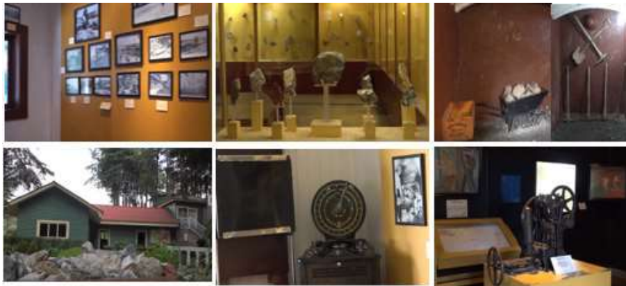
Figura 6. Conjunto de fotografías. Museo de Minería del Estado de México.

Fue una mina del siglo XX de pertenencia inglesa, activa entre 1915 a 1926 llamada "La Providencia". Alcanzó una profundidad aproximada de 300 m. En segundo término, perteneció a la cooperativa minera Dos Estrellas, y en el tiempo presente es un museo que ofrece la exposición de fotografías, documentos, planos, maquinaria de la actividad minera y bonanza de la época. Las salas de exposición albergan patrimonio histórico, cultural y geológico. Posee más de 250 muestras de rocas y minerales propias del Distrito Minero Tlalpujahua-El Oro y de otros municipios del Estado de México. Los rasgos mineros son visibles al conservar la bocamina de la época (Figura 6).