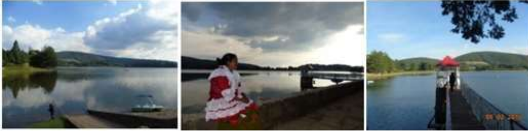
Figura 3. Conjunto de fotografías de la presa Brockman.

artesanías y alimentos). Alrededor de la presa existe un bosque variado de encino y oyamel característico de un clima subhúmedo (Figura 3).