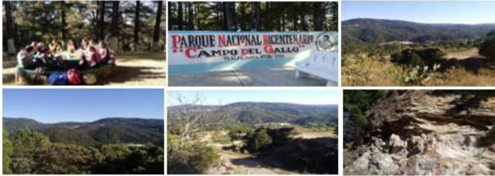
Figura 8. Conjunto de fotografías. Geosito Campo del Gallo.

Definidas las características físicas y los principales valores de cada geosito, se identificaron los impactos ambientales que pueden afectarlos. Lo anterior, se sustentó bajo un detallado trabajo de campo y la revisión bibliográfica. Se identifican impactos ambientales ya existentes, ocasionados por la actividad minera durante los siglos XVI, XVIII y XIX y agudizados por procesos actuales (Tabla 4).