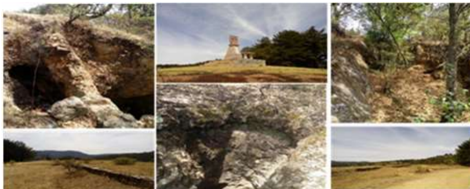
Figura 7. Conjunto de fotografías. Socavón en el Cerrito Lacolot.

El sitio es de interés turístico, aunque no concurrido, con buena vista del paisaje y los restos de la capilla del antiguo seminario de monjas (Figura 7).