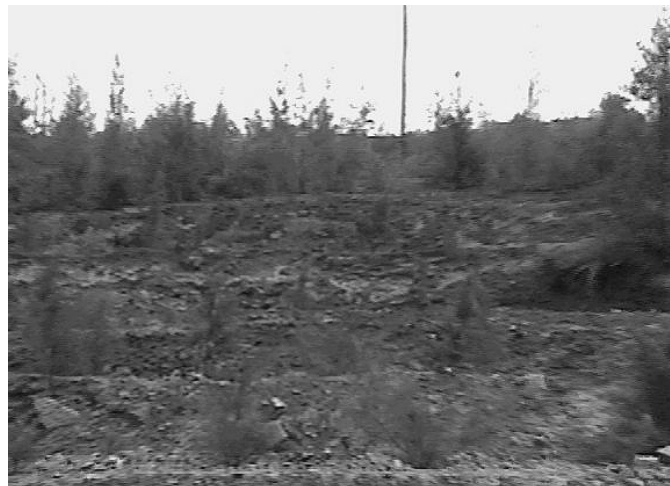
Figura 3. Zona reforestada con pinos.

forestal de extracción de madera, ocasionan graves daños al medio ambiente.