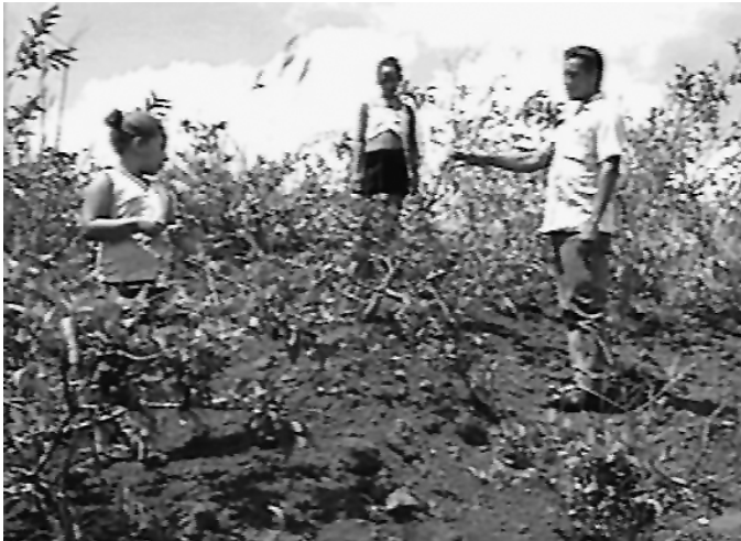
Figura 4. Niños y maes ro en un área recul ivada con ocuje.

tos. Las vías utilizadas para influir en esta población han sido las organizaciones comunitarias y el consultorio médico de la familia. La labor de este último es sistemática a través de charlas y orientaciones en las consultas médicas, en las visitas de terreno a las casas y en el trabajo con los círculos de abuelos y adolescentes. Entre las principales actividades realizadas cabe destacar: