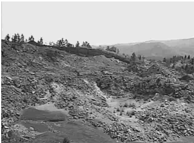
Figura 2. Zona abandonada luego de la explotación minera.