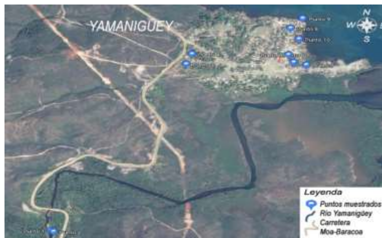
Figura 1. Imagen satelital de ubicación de los puntos muestreados.